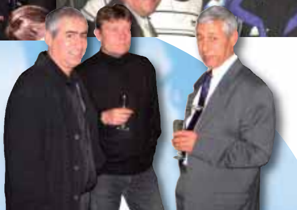
Moments de convivialité et de sympathie lors de cette soirée d'anniversaire.

Les festivités se sont poursuivies tard dans la nuit, après un repas dansant très animé.